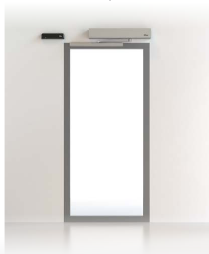
PORTA A BATTENTE DAB E SPRINT