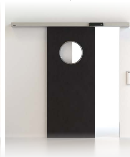
PORTA SCORREVOLE CIVIK E DAS